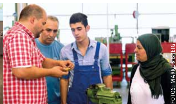
In future, digital translation systems are to replace translation aids at workshops