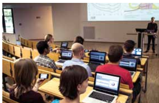
Digitale Übersetzungssysteme sollen in Zukunft auch die Übersetzungshilfen in Werkstätten ersetzen